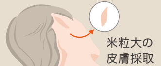
米粒大の皮膚採取

ご持参ください ●銀行引き落とし通帳・印鑑お持ちください(採取前にセルバンクとの書面契約締結)。 ●契約時にお渡しさせていただきました同意書をお持ちください。